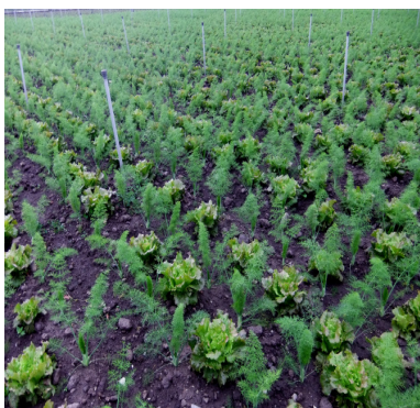
Coltura a 40 giorni dal trapianto

Durante la coltivazione in entrambi gli appezzamenti sono stati somministrati concimi chimici di copertura a base di nitrato di calcio e nitrato potassico.