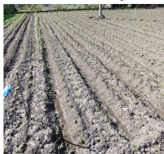
Trapianto della canasta “Meravilla di Verano”

Le prove sono state condotte in territorio di Adrano presso l'azienda Dell'Aquila (C.da Marabù - 180 m. s.l.m.) e presso l'Azienda Fratelli Petralia (C.da Ruggero - 300 m. s.l.m).