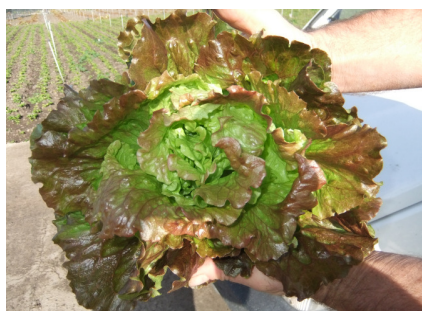
Canasta in fase di raccolta