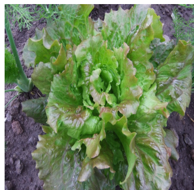
Canasta a metà sviluppo

Ogni 7-10 giorni le piante venivano controllate per verificare la presenza del tripide; durante l'osservazione la presenza del tisanottero è stata riscontrata su poche piante.