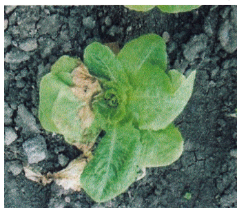
Lattuga con sintomi di TSWV

Questa situazione ha indotto la maggior parte degli ortolani ad abbandonare la coltivazione di lattuga.